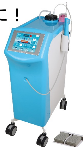
VAB生検装置 ベクスコア : BexCore

持続吸引を可能にしたBexCoreは、腫瘍組織をニードルから離さずに維持してくれるので、連続した早い生検が可能です。またこの持続した吸引は、出血した血液を除去してくれるので、明瞭なエコー観察が可能になりました。